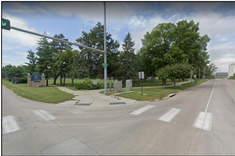
Pentzer Park looking southwest from N. 27th & Fair Streets.