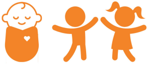
Trẻ sơ sinh và trẻ nhỏ

Nắng nóng gắt có thể ảnh hưởng tất cả mọi người. Những người có nguy cơ cao hơn bao gồm: