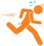
Người tập thể dục ngoài trời