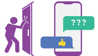
Thăm chừng gia đình, bạn bè, hàng xóm và thú nuôi