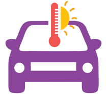
Không để trẻ em hoặc vật nuôi trong xe đang đỗ