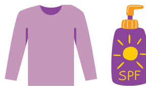
Mặc quần áo rộng rãi, sáng màu và bôi kem chống nắng khi đi ra ngoài