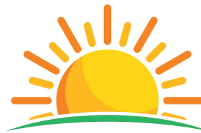
Hạn chế các hoạt động ngoài trời