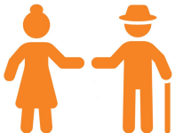
Người cao niên